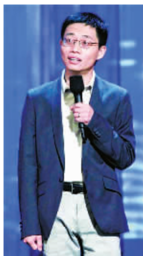
黄西表演时表情其实很木讷。

曾在中科院攻读硕士,后获得德克萨斯州莱斯大学博士学位,全职工作从事科学研究。2009年亮相美国深夜节目收视率冠军的“大卫·莱特曼秀”,以英语讲美式笑话,近6分钟的演出,观众反应热烈。从此一炮而红。