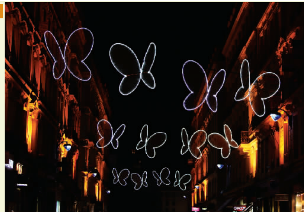
整个里昂城都被各式各样的彩灯点缀一新,五彩斑斓的绚烂景观渲染着整个里昂市。

据史料记载,真正的“灯光节”的由来更具传奇色彩。1852年,里昂人重建大教堂的钟楼,并重塑圣母马利亚的镀金铜像。原计划在当年9月8日即圣母诞生日举行纪念活动,但是索恩河突然涨水,纪念活动不得不推迟到12月8日。孰知12月8日上午,里昂下了一场特大暴雨。正当大主教准备宣布再次推迟纪念活动、里昂人也变得垂头丧气时,大雨在傍晚时分终于停下来,天空完全放晴。兴奋的人们纷纷在窗前点起蜡烛,并走上街头载歌载舞。满城的烛光直到次日天明才渐渐熄灭。自此,12月8日就正式定为“灯光节”的开始日,并最终演变成一个世界著名的节日。